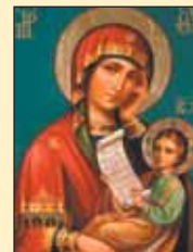
Икона Божией Матери «Утоли моя печали»

7 февраля — празднование в честь иконы Божией Матери «Утоли моя печали». Чтимая икона Божией Матери «Утоли моя печали» есть в храме Ризоположения в Леонове.