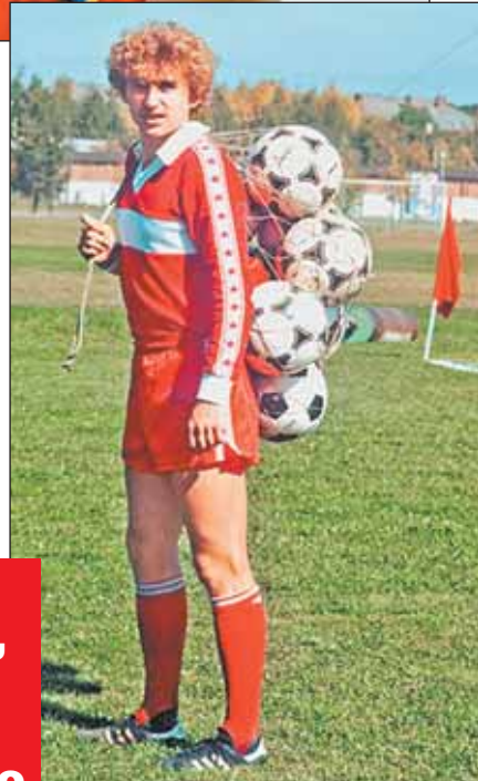
На тренировочной базе «Спартака» в Тарасовке. 1983 г.

Сейчас я засыпаю и просыпаюсь с молитвой. Заметил однажды: если вдруг забыл помолиться, всегда тяжелые сны снятся. Я думаю, что болезнь