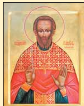
Икона священномученика Павла, пресвитера Леоновского

Павел Фелицын родился в 1894 году в семье священника в Московской губернии, окончил духовное училище, воевал в Первую мировую. С 1931 года служил священником в храме Ризоположения в Леонове, живя здесь же в доме причта. Был арестован во время кровавых гонений на Церковь в 1937 году вместе с другими священниками и мирянами, жившими в Леонове. Его заключили в Таганскую тюрьму в Москве и по ложному обвинению в контрреволюционной агита-