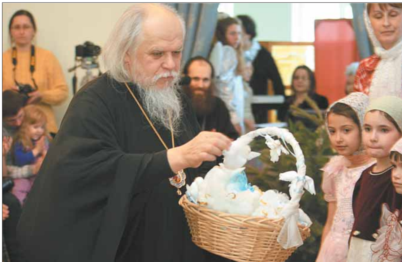
На празднике в усадьбе Свиблово