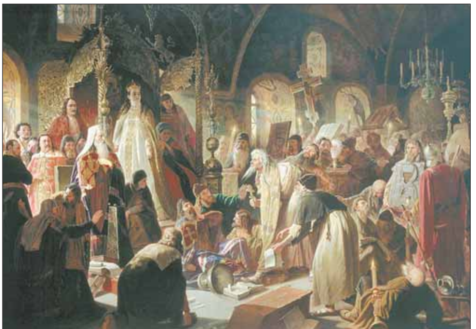
Василий Перов. «Никита Пустосвят. Спор о вере». 1880-1881