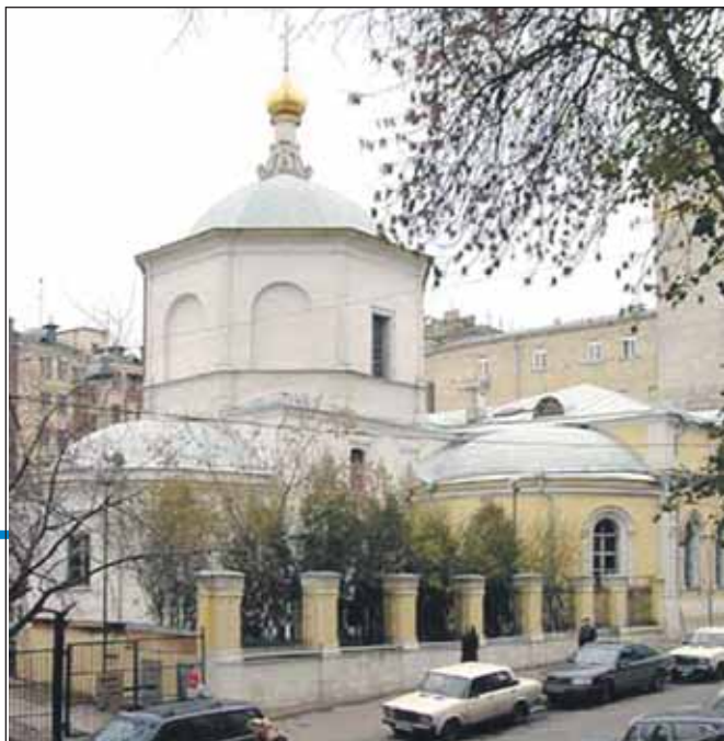
Храм св. Космы и Дамиана в Шубине

Второй раз явились в 1983 году. В семь утра звонок в дверь: «Телеграмма!» Открываю: милиция, понятие... Позже в разговоре меня спросили: «Вы что, нам не верите?!» — «А как верить, если вы меня с порога обма-