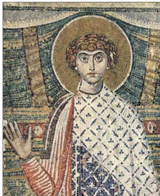
Мозаичная икона св. великомученика Димитрия Солунского в г. Салоники

Есть старинный обычай: в дни поминовения верующие приносят в храм угощение, которое потом раздаётся нуждающимся и немощным. Принято было также подавать милостыню немощным с просьбой помолиться об усопших.