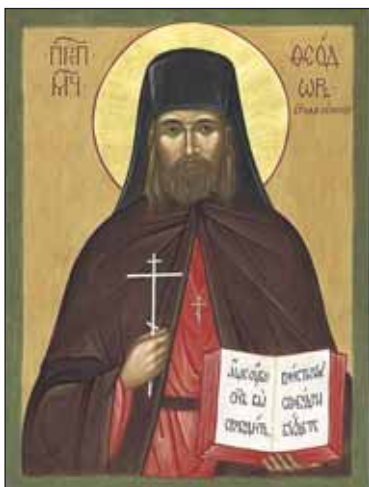
Икона преподобномученика Феодора