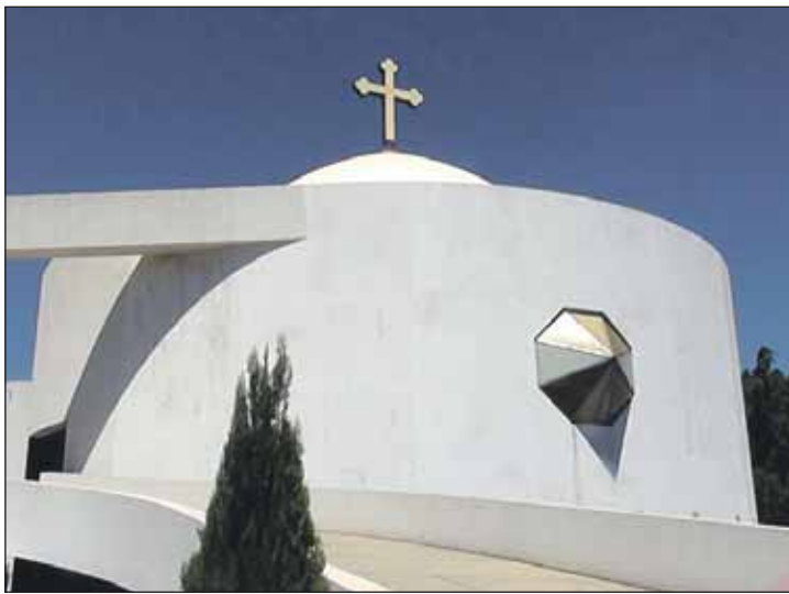
Храм похож на пасхальный кулич

Но православный храм и без колокольного звона ни с чем не спутаешь. Хотя не очень похож на наши церкви этот храм Георгия Победоносца, принадлежащий Антиохийскому Патриархату. Вот он, передо мной, во всей красе. В белой-белой глазури — пасхальный «кулич» с белой паролонной трубой-колокольной. На маковке ослепительно сияет золочёный крест. Вот так храм! Всё непривычно. Первый этаж напоминает скорее офисное пространство. Посреди зала прос-