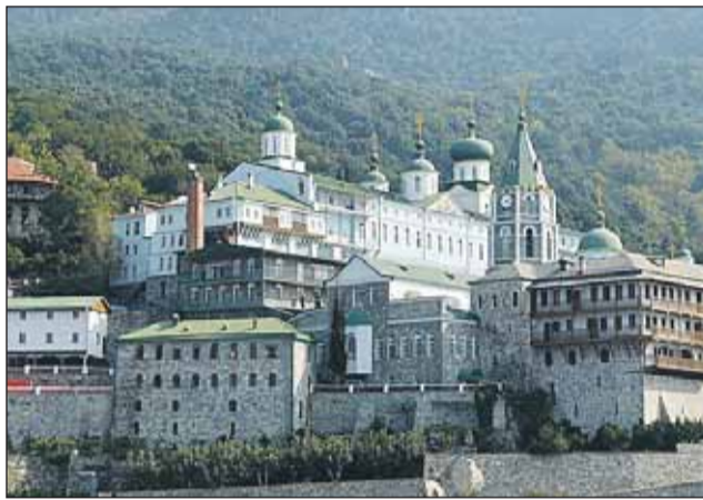
Русский монастырь на Афоне

— Да, многим. У нас в картотеке уже 2 тысячи человек. Кто-то из них обратился к нам, кого-то мы нашли сами. Мы уже компьютеризировали эту картотеку, и теперь у нас получается отслеживать важные даты в их жизни, например поздравлять этих людей с днём рождения. Ведь их проблема — не только финансовая. Актёры-ветераны очень одиноки. И для них имеют огромное значение моменты, когда о них вспоминают.