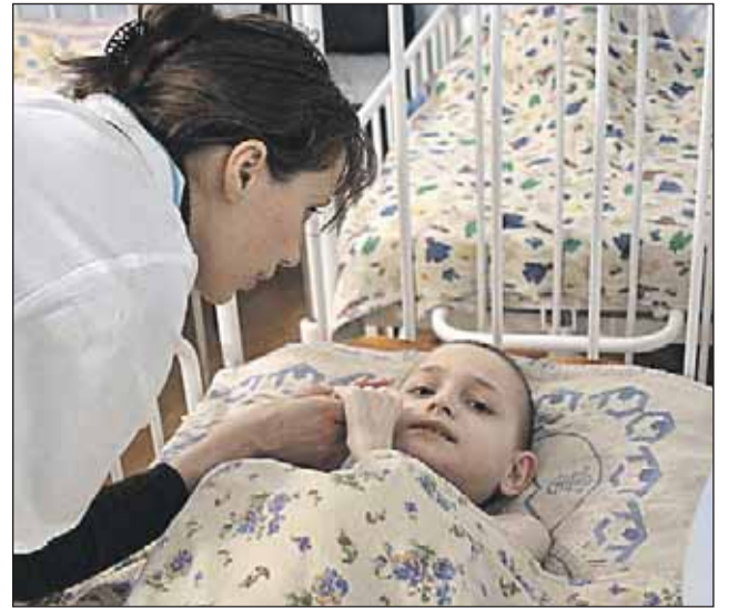
Детям в интернате не хватает внимания и любви

Ещё одно правило службы: не вмешиваться в семейные дела. Хотя порой и хочется. К примеру, волонтер ухаживает за пожилой женщиной на коляске. А в той же квартире живет её сын, но не обращает на мать внимания.