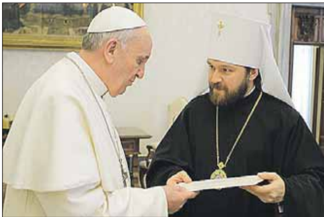
Владыка Иларион встретился с новым понтификом в Ватикане

Главой католической церкви недавно избрали аргентинского кардинала Бергольо, который стал Франциском I. Что он за человек? Как скажется его избрание на политике Ватикана и на отношениях с нашей Церковью? Об этом говорил с журналистами председатель отдела внешних церковных связей Русской Православной Церкви митрополит Иларион.