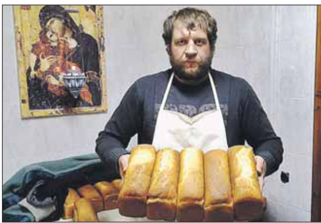
Послушание в пекарне.

«Уважаемые фанаты, последние несколько месяцев я провёл в православном монастыре на Афоне в Греции, где много общался со старцами, монахами, — сообщил в своем интернет-дневнике известный боец смешанных единоборств Александр Емельяненко. — Моё общение со старцем, его совет и благословение возвращаться в спорт заставили меня всерьёз задуматься об этом. Я решил, что хочу снова выступать на ринге и своими выступлениями популяризировать этот вид спорта среди детей и юношей... Будьте здоровы! Занимайтесь спортом! Верьте в Бога!»