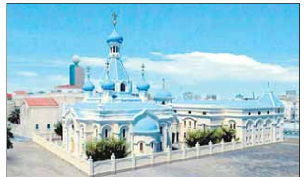
Компьютерный образ храма вот-вот станет реальностью

Строительству предшествовали длительные переговоры между священноначалием РПЦ и правителем эмирата Шарджа, а так-