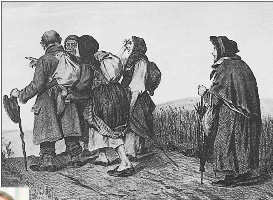
В.Перов. «Паломники на богомолье»

— У каждого человека в религиозной жизни, и не только, есть формы обязательного должностования, а есть просто формы проявления своего чувства. Обязательно ли дарить любимой девушке цветы? Нет, устава любовных отношений не существует. То же и с паломничеством. Как передвижение в пространстве оно не обязательно. Главное для христианина — совершить внутреннее паломничество, отойти от состояния несвободы, плененности низкими привычками и пройти дорогу до свободы во Христе. Как в случае с наркоманом, которому для избавления от