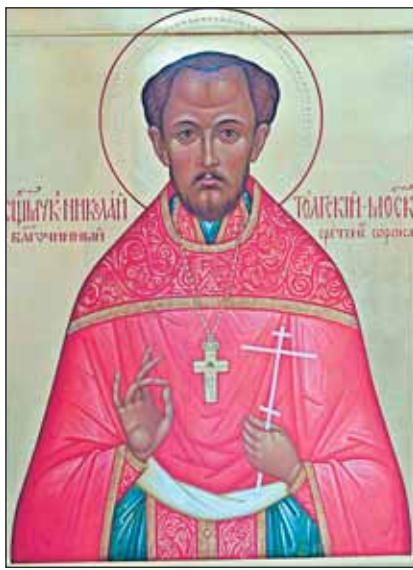
Икона священномученика Николая Толгского

ции Японии против СССР. Для этого, утверждало следствие, «в разных населенных пунктах СССР, вплоть до рабочих центров, на фабриках были организова-