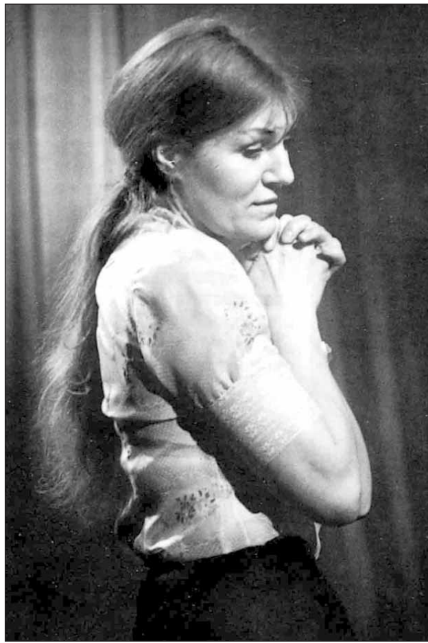
Уже тяжелобольная, она написала песню на слова псалма

Другой сюжет посвящен поэту Генриху Гейне и его книге «Лазарь». Он писал о своем последнем сборнике, куда вошел и «Лазарь»: