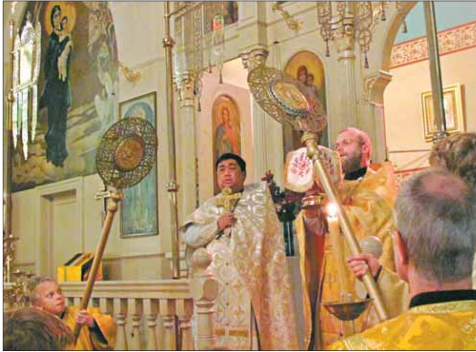
В Индонезии богослужения имеют национальный колорит

Я спросил ее, в чем дело, и она рассказала мне, что у нее рак и что опухоль не удалось вовремя удалить — это было бы слишком опасно для нее. Она спросила, могу ли я помолиться о ней. Я сказал: