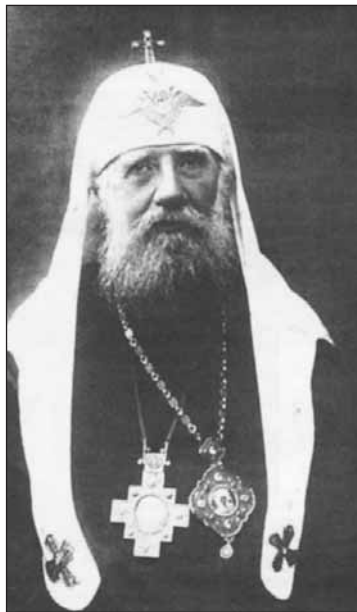
Патриарх Тихон был единственным человеком, кто возглавил Церковь по жребию

при выборе становится голос широкой церковной общественности с участием мирян, но архиереи определяют круг кандидатов. Во втором, наоборот, архиереи выбирают из тех, кого предложили на широком форуме. В третьем — все решается только на Архиерейском соборе без участия мирян. Четвертый вариант идентичен первому за исключением того, что Поместный собор может выдвинуть дополнительного кандидата. Именно по такому сценарию прошли последние выборы.