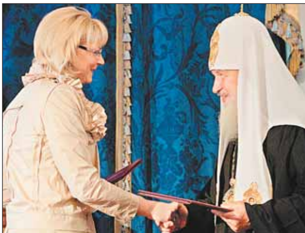
Министр Татьяна Голикова и Патриарх Кирилл достигли полного взаимопонимания