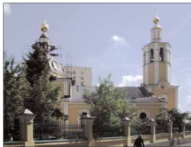
Храм Всех Святых во Всехсвятском на Соколе