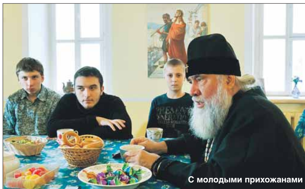
С молодыми прихожанами

И вот они передо мною. Пригласил гостей на обед. Поговорили хорошо. Жизнь их сильно изменила. С тех