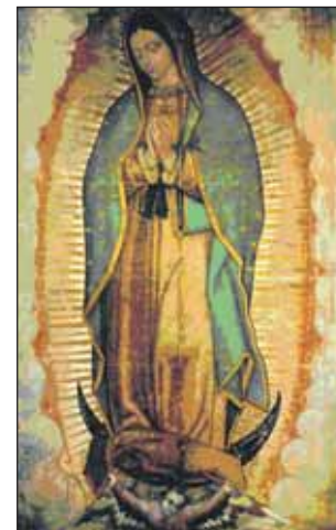
Икона Девы Марии Гваделупской