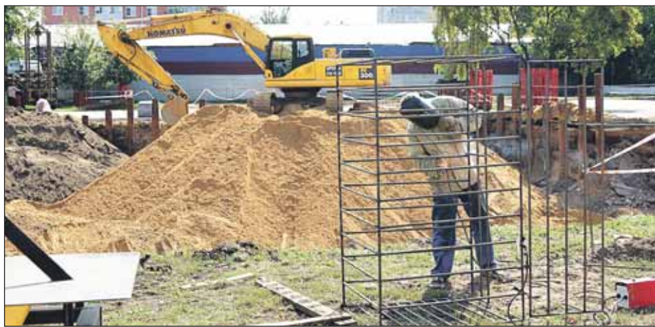
Готов котлован для фундамента храма на Дубровке