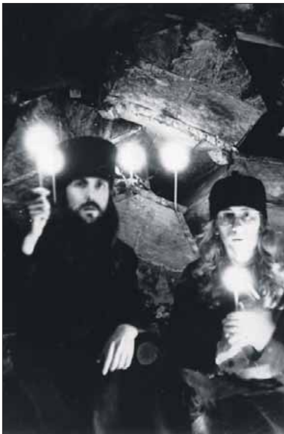
Монахи Печерского монастыря в пещерах, где покоятся 14 000 иноков.

И вот об этом прекрасном мире, где живут по другим законам, где много ярких людей, чудес, любви и открытий, отец Тихон рассказывает в своей книге. Он талантливый рассказчик — от чтения не оторвёшься. Тут есть и погони, головокружительные сюжеты, в которых переплетены трагические и анекдотические события. А персо-