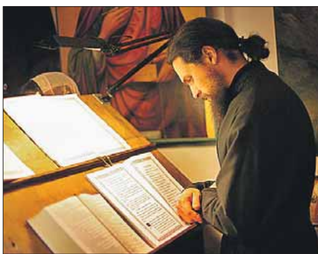
браны и проанализированы все отзывы. А в феврале 2012 года документ может быть принят Межсобор-

К обсуждению документа приглашаются все желающие. Осенью будут со-