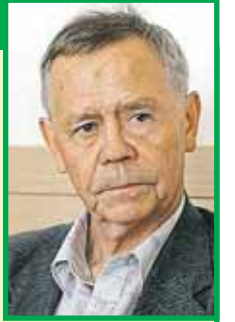
Валентин Распутин, писатель

« У русского человека не остаётся больше другой опоры, возле которой он мог бы укрепиться духом и очиститься от скверны, кроме Православия. Всё остальное у него отняли или он промотал. Не дай Бог сдать это последнее».