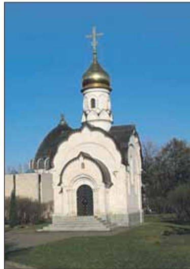
Храм-часовню Святого Василия Великого на ВВЦ в конце августа пытались поджечь

— Как, на ваш взгляд, рядовые прихожане могут сейчас воспрепятствовать худшему развитию событий? Можем ли мы остановить зло какими-то действиями? Или нужно только запастись терпением и молиться?