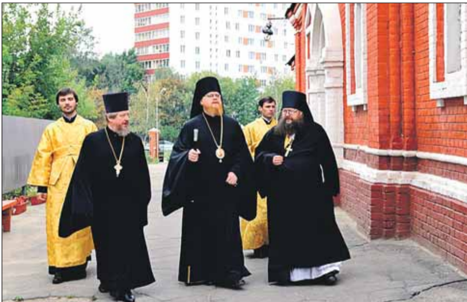
Епископ Подольский Тихон (в центре) посетил в Бибиреве новый храм Собора Московских Святых в день его престольного праздника

Своё ноу-хау в сборе средств на стройку есть у прихода другого нового храма на юго-востоке. Настоятель прихода в честь