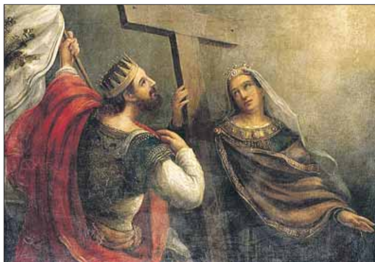
Святые Константин и Елена вокруг Животворящего Креста Господня (картина В.К.Сазонова, XIX век)

Воздвижение Креста Господня — единственный из больших церковных праздников, получивший своё начало одновременно с самим событием, которому он посвящён. Случившийся в 325 году в Иерусалиме факт сразу стали праздновать. Ведь произошло это, в отличие от большинства событий, ставших основой церковных праздников, гораздо позже евангельских времён. Христианство уже перестало быть гонимым, вышло из подполья. И когда поиски Креста, на котором был распят Христос, увенчались успехом, это вызвало широкое ликование христиан и торжество, которое вошло в традицию вплоть до наших дней.